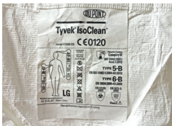
Figura 1. Esempio di prodotto dotato di marchio CE e documentazione

Standard di qualità per il Servizio di farmacia oncologica, European Society of Oncological Pharmacy, Amburgo 2014.